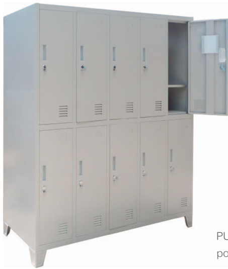
PUERTA: tirador y portacandado metálico